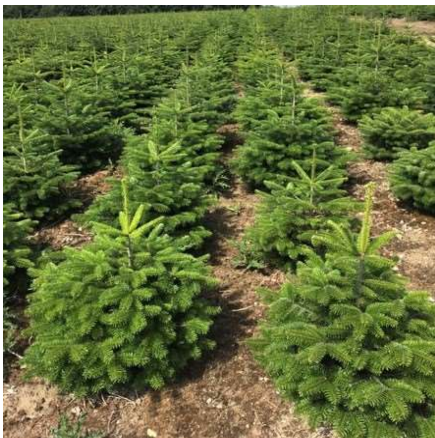
Quartierfläche mit Abies nordmanniana im Frühjahr

Ihre Ansprechpartner der Landwirtschaftskammer für den Pflanzenschutz vor Ort: