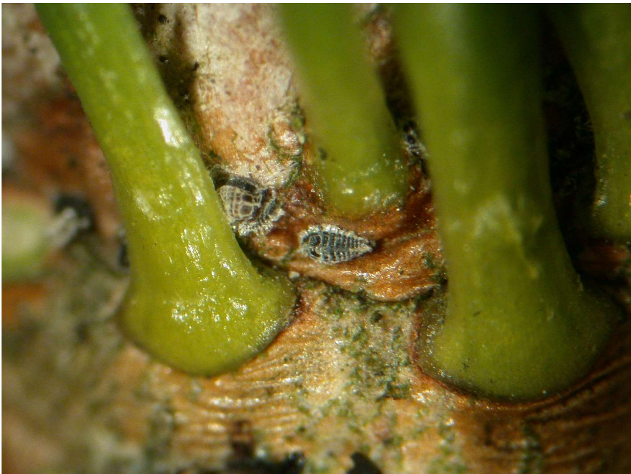
Tannentriebläuse an Abies nordmanniana

In einigen Weihnachtsbaumbeständen konnten auf den Stämmen von Abies nordmanniana unter Wachswolle überwinternde Tannentriebläuse festgestellt werden. Bei Bedarf können ölbasierte Pflanzenschutzmittel wie z.B. Micula (Rapsöl, 12-24 l/ha je nach Pflanzengröße) im Rahmen von Austriebs-spritzungen eingesetzt werden (Pflanzenverträglichkeit testen).