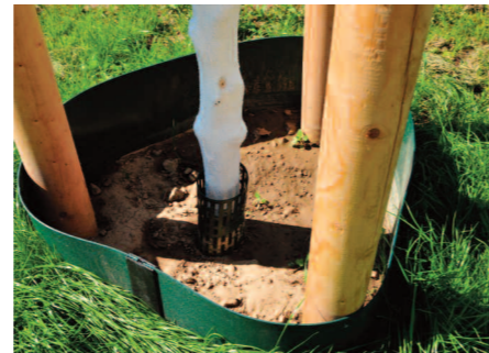
Die Pfeile in der nebenstehenden Abbildung deuten an, wo das Wasser versickert, wenn der Gießbrand richtig erstellt wurde (verändert nach FLL 2015, Empfehlungen für Baumpflanzungen – Teil 1)