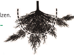
Verändert nach LWF Bayern – Merkblatt 18