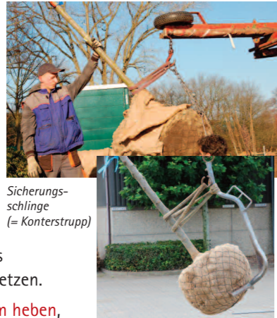
Sicherungsschlinge (= Konterstrupp)