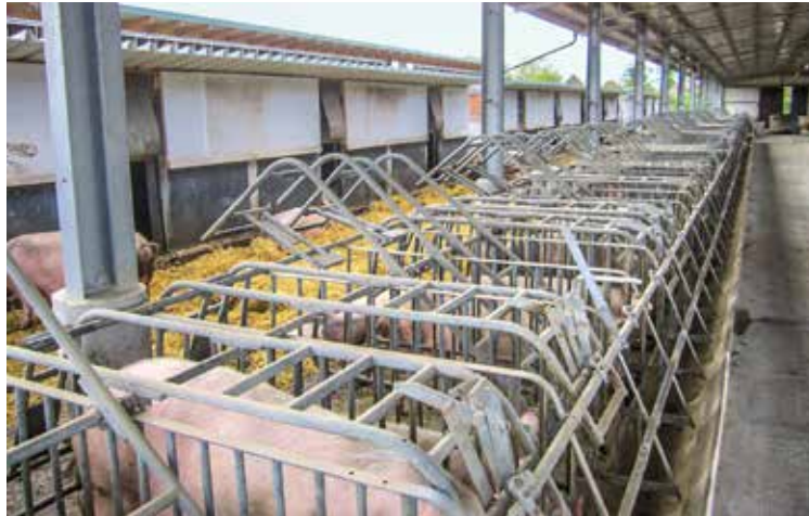
Für tragende Sauen eignet sich die aufgelöste Bauweise im besonderen Maße. Auf der einen Seite stehen die wärmedämmten Liegehütten. Dem schließt sich der teilüberdachte Auslauf an und am Bediengang befinden sich die Einzelfressstände.

Mit ihrem Vortragstitel „Bioschweinehaltung: Möglichkeiten