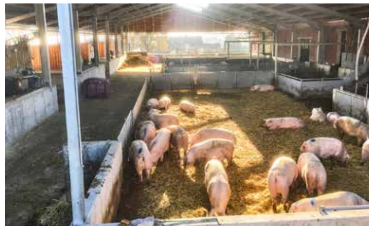
Bei den tragenden Sauen wurde eine bestehende Halle in das Stallkonzept integriert. Große Öffnungen im Dach und an den Seiten lassen die Schweine mit Wind, Regen und Sonne jederzeit in Kontakt kommen.

chende Gitter der Raufe sehr schräg montiert und gleichzeitig eine Betonaufrichtung errichtet, können die Schweine an dieser Stelle nicht koten und aus der Raufe herausfallende Silage kommt nicht mit Kot in Berührung.