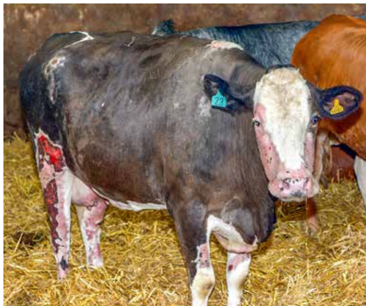
In schweren Fällen können Räudemilben binnen kurzer Zeit große Hautpartien befallen. Die nachfolgende bakterielle Besiedlung sowie Scheuerverletzungen führen zu tiefen Wunden, die nur langsam heilen.

Der Befall mit der Nagemilbe führt typischerweise zum Bild der Schwanz- oder Steißbräude. Dabei können aber auch die Hinterseiten der Hinterbeine, der Euterspiegel