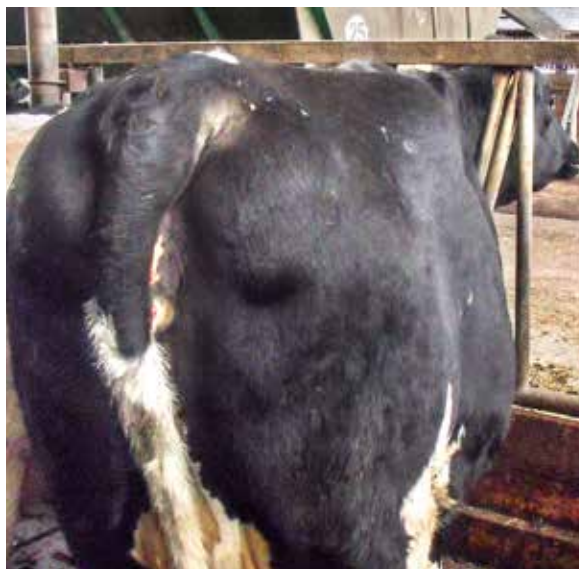
Steißbräude beginnt oft als unscheinbare Ausdünnung der Haare an der Schwanzbasis. Von dort kann sich die Erkrankung weiter ausbreiten.

dem sind sie auch durch Kriechen in der Lage, wenige Meter im Stall selbstständig zurückzulegen. Während die Milben im Winter sehr aktiv sind, scheint es aber auch Ruhestadien für die Sommermonate zu geben, da sich Milben, die in der warmen Jahreszeit gewonnen wurden, als deutlich robuster und zugleich weniger aktiv erwiesen. Dies begünstigt das Überleben über den Sommer hinweg vor allem an den schattigen Bereichen des Rinderkörpers an Unterbauch, Fesselbeuge und Kronsaum, wie es für Nagemilben beschrieben ist.