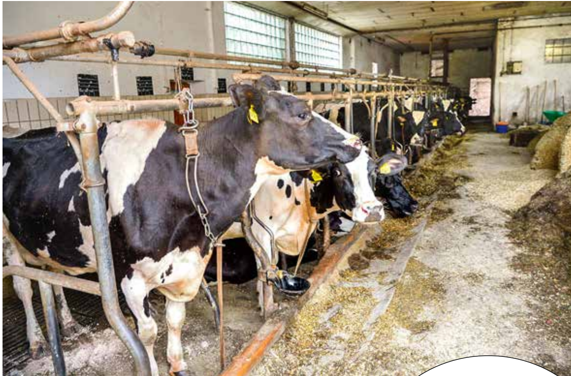
Unzeitgemäße Stallhaltungsformen mit niedrigen Decken, unzureichender Lüftung und hoher Besatzdichte sowie Bewegungsmangel belasten das Rind und schwächen die körpereigene Abwehr: Hautkrankheiten werden so begünstigt.

sowie die Schenkelfalten betroffen sein. Neben dem starken Kribbeln durch die nagenden Milben treten auch allergische Reaktionen auf deren Ausscheidungen auf, die das Leiden der erkrankten Rinder vergrößern. Auch hier ist eine tierärztliche Behandlung unverzüglich anzustreben.