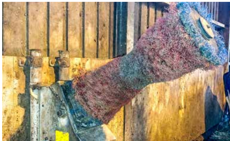
Bei der konsequenten Räudebekämpfung müssen auch der Stall und die Einrichtung einbezogen werden, um Rückzugsräume der Milben auszuschalten.

Wie bei vielen anderen Erkrankungen auch erkrankt