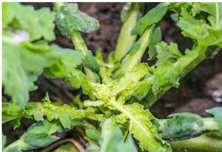
Die Rapsknospen waren bereits Anfang Februar in den meisten Rapsbeständen schon von oben zu erkennen.

Behandlungen mit Wachstumsreglern beziehungsweise Fungiziden zur Kontrolle der Winterfestigkeit und der Standfestigkeit im Frühjahr sind ein wichtiger Produktionsfaktor im Rapsanbau. Klar wird bei dieser Thematik jedoch auch, dass die Notwendigkeit dieser Maßnahmen nicht in je-