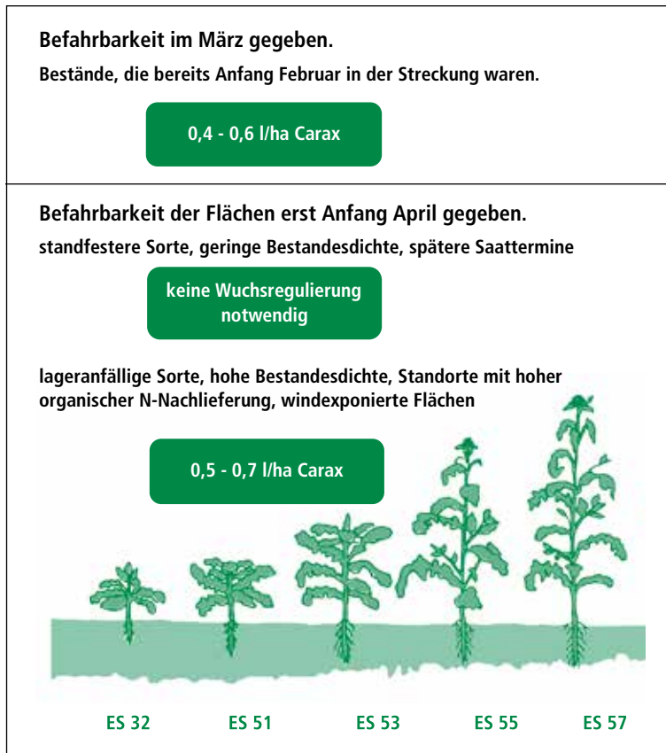
Abbildung 2: Wachstumsreglereinsatz bei unterschiedlicher Befahrbarkeit der Flächen

eine geringere Wuchshöhe als andere Sorten aufzeigen. Bei den kohlhernieresistenten Sorten sind es ‚PT 284‘, ‚SY Alibaba‘, ‚Mentor‘ und ‚DK Platinium‘.