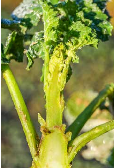
Durch den milden Winter und die hohen Temperaturen im Januar sind die ersten Bestände bereits Anfang Februar 2020 (Bild li.) und damit rund zwei Wochen früher als im vergangenen Jahr (Bild r.) ins Streckungswachstum übergegangen.

versuchen im Jahr 2019 in Schleswig-Holstein, so zeigt sich, dass gerade die Sorten ‚PT 256‘, ‚DK Exception‘, ‚Puzzle‘, ‚Penn‘ und ‚Hatrick‘