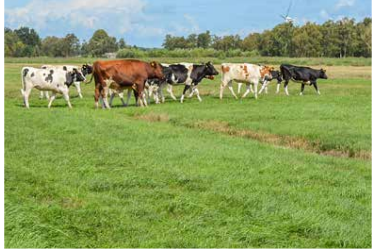
Eine an den Standort- und die Artenzusammensetzung angepasste Nutzung fördert die Produktivität der Grasnarbe nachhaltig.