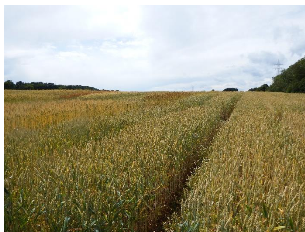
Ökowinterweizen in Futterkamp 2023