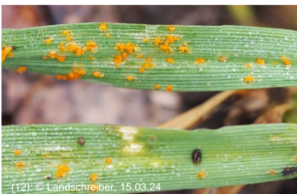
(12): © Landschreiber, 15.03.24