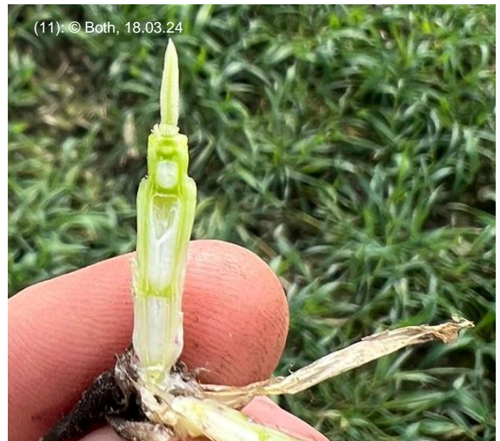
(11): © Both, 18.03.24

In einigen Beständen ist Braunrost auffällig. Neben einzelnen Pusteln ist auch stärkeres Auftreten auf den unteren Blättern erkennbar (Bild 12). Rhynchosporium ist momentan noch verhalten vorhanden.