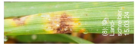
(8): © Landschreiber, 15.03.24

Je nach Sorte sind in der Wintergerste momentan alle Krankheiten mehr oder weniger präsent. Mehltau, Zwergrost (Bild 8) und auch vermehrt Netzflecken (Bild 8) sind in diesem Frühjahr keine Seltenheit.