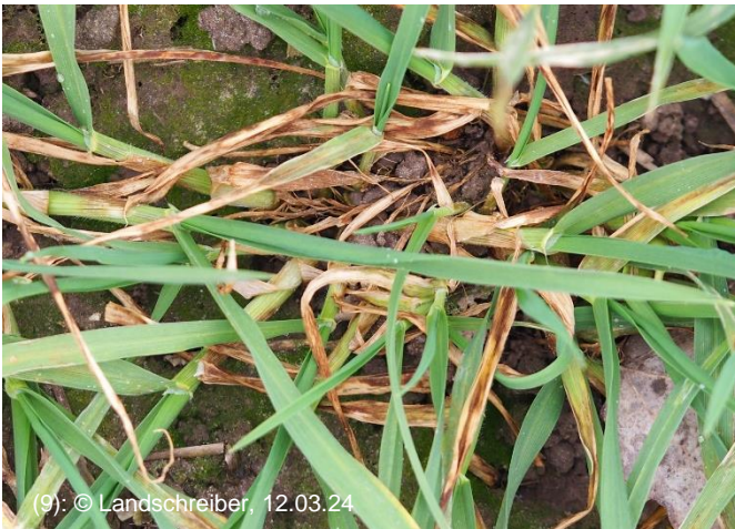
(9): © Landschreiber, 12.03.24

Eine gewisse Sonderrolle nimmt die Krankheit Rhynchosporium in der Sorte SU Midnight ein. An einzelnen Standorten geht die Ausprägung über die bekannte „Nestersymptomatik“ weit hinaus. Flächiges Auftreten mit vermehrtem Verlust an Blattmasse (Bilder 9, 10) kann ggf. ein frühzeitiges Handeln mit Prothioconazol-haltigen Produkten erfordern. Befallene Blätter oder Triebe können über diese Maßnahme aber nicht geheilt werden, nur der Neuzuwachs wird geschützt. Befallene Blattmasse verbleibt als Infektionsquelle im Bestand. Weitere Infektionen sind dann an Regenereignisse gekoppelt. Ist bei aktuell flächigem starken Befall eine vorgezogene Behandlung erforderlich, sollte diese somit vor Niederschlägen in Kombination mit Blattzuwachs durchgeführt werden, um eine Infektion der frisch geschobenen Blätter zu unterbinden. Bei „moderatem“ Befallsdruck (einzelne Befallsnester) kann diese Maßnahme mit dem Wachstumsregler in ES 31-32 kombiniert werden. Eine Frühjahrstrockenheit würde – so wie im letzten Jahr – auf natürlichem Weg die Krankheit stoppen. Nur bis dato gesetzte Infektionen treten bedingt durch die lange Latenzzeit dann später auf.