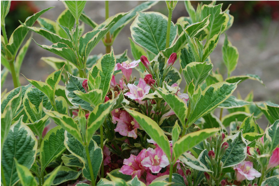
Abb. 3: 'Nana Variegata' im Frühsommer 2012 (Note 9,0 für den Zierwert des Laubes)