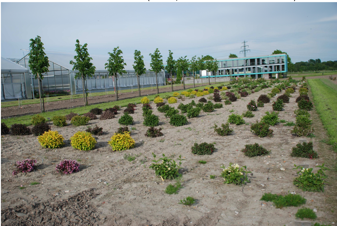
Abb. 5: Überblick über das Prüfsortiment von Weigela Thunb. Im Frühsommer 2010 im Gartenbauzentrum der Landwirtschaftskammer Schleswig-Holstein in Ellerhoop