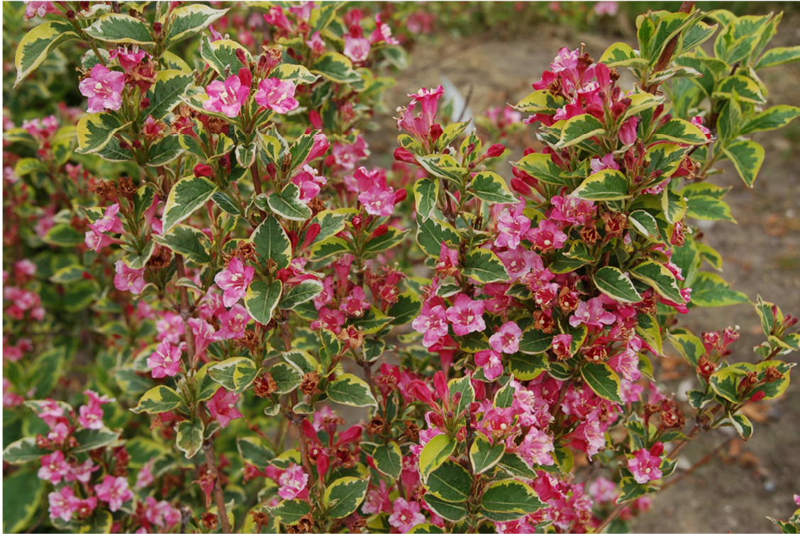
Abb. 2: 'Kosteriana Variegata' im Frühsommer 2012 (Note 9,0 für den Zierwert des Laubes)