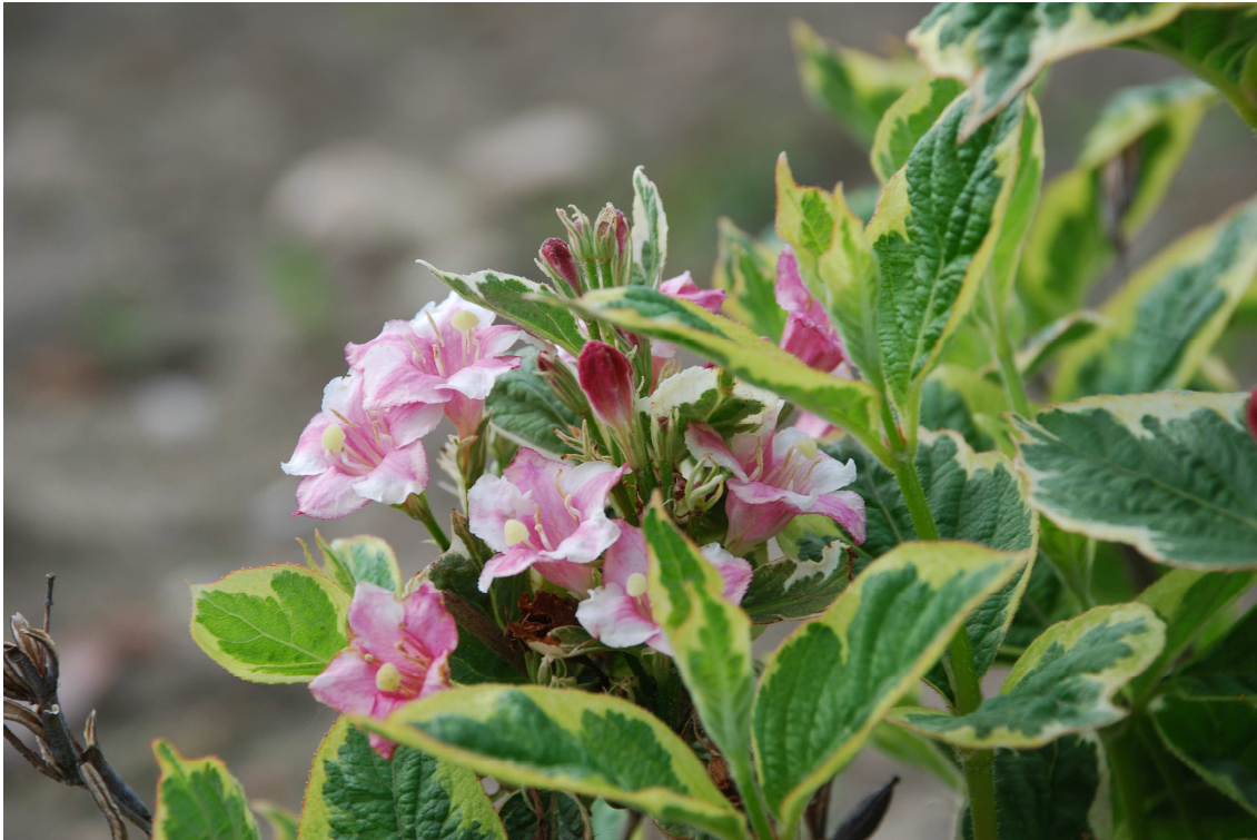
Abb. 4: 'Wessex Gold' im Frühsommer 2012 (Note 9,0 für den Zierwert des Laubes)