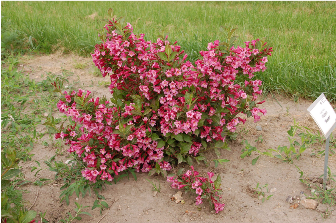
Abb. 3: 'Minuet' im Frühsommer 2012 (Note 9,0; auch für Grabbepflanzungen geeignet)