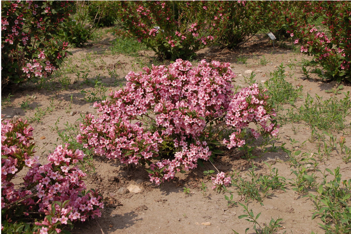
Abb. 2: 'Pink Poppet' im Frühsommer 2012 (Note 9,3; auch für die Grabbepflanzung geeignet)