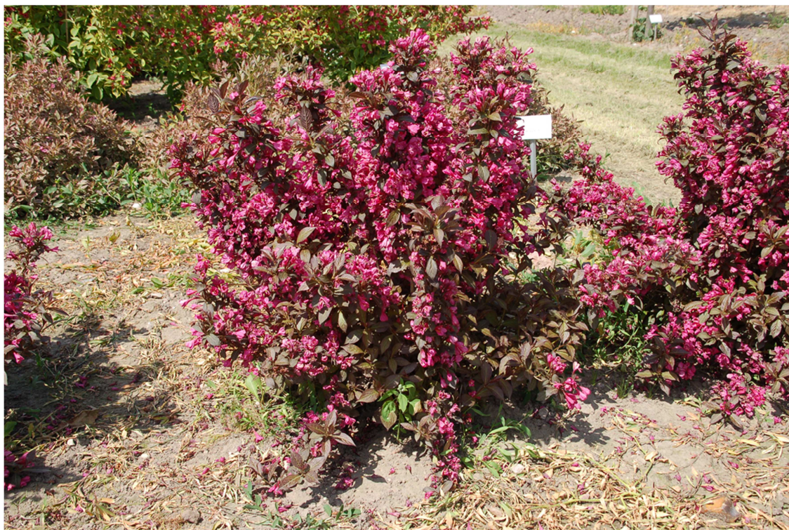
Abb. 4: 'Minor Black' im Frühsommer 2012 (Note 9,0; auch für Grabbepflanzungen geeignet)