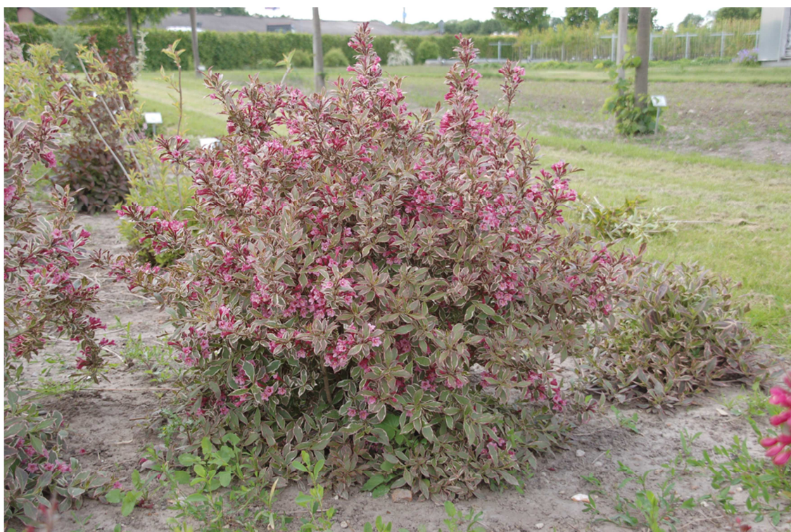
Abb. 5: 'Monet' im Frühsommer 2012 (Note 9,3; sehr kompakt aber nicht so schwachwüchsig, dass sie sich für ein Grabbepflanzung eignen würde)