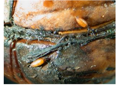
Rechts: Puppen der Walnussfruchtfliege unter der Fruchtschale

Die Fliegen treten von Juli bis September auf und legen ihre Eier in die grünen Fruchtschalen der Walnüsse ab. Nach ca. einer Woche schlüpfen die Larven und fressen im Inneren der Fruchtschale. Nach 3 bis 5 Wochen verlassen die Maden die Frucht und fallen zu Boden, wo sie sich verpuppen (z. T. fallen sie auch mit Frucht zu Boden). Die erwachsenen Fliegen schlüpfen erst im nächsten Jahr. Zu den Gegenmaßnahmen zählen das Aufsammeln und Entfernen befallener Früchte, das Auslegen einer Folie oder eines dichten Netzes unter dem Baum, um heruntergefallene Früchte abzusammeln und das Einwandern der Larven in den Boden zu verhindern. Wird die die Abdeckung bereits ab Juli durchgeführt, kann damit auch der Schlupf der Fliegen aus dem Boden verhindert werden. Ab Juli können auch Gelbtafeln in die Krone gehängt werden, um einen Teil der Fliegen abzufangen. Pflanzenschutzmittel zur Bekämpfung der Walnussfruchtfliege stehen nicht zur Verfügung.