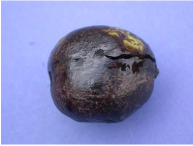
Links: mit der Walnussfruchtfliege befallene Walnussfrucht

Fliegenmaden sichtbar. Der Nusskern wird nicht betroffen. Walnussfruchtfliegen bilden nur eine Generation im Jahr aus.