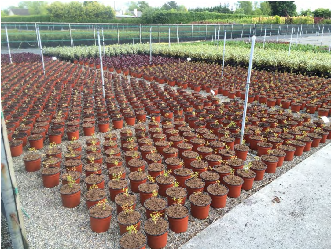
Abb. 16: Die Produktion, hier frisch getopfte Spirea , findet bei Rentes Plants auf Containerkulturflächen statt, die nicht mit Bändchengewebe abgedeckt sind, sondern mit Kies