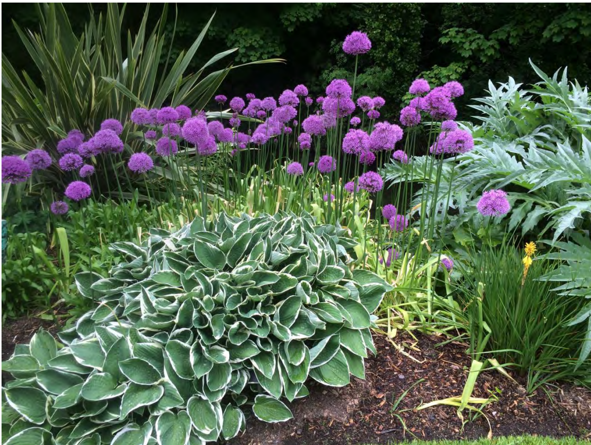
Abb. 4: Impression aus einem Teil des Themengartens für 'Stauden'