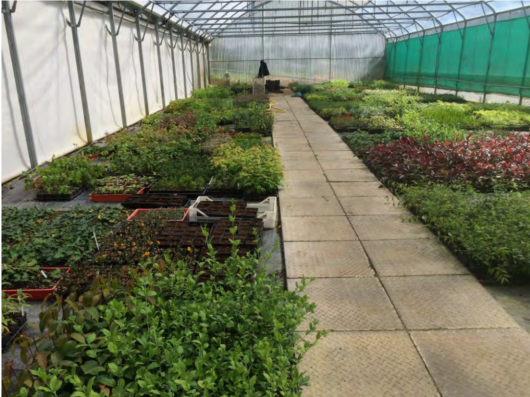
Abb. 7: Gewächshaus mit Jungpflanzen verschiedener Gehölze im Tb9