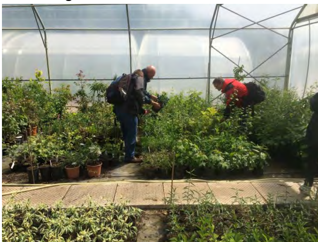
Abb. 6: Im Raritätenhaus der Baumschule Ravensberg findet jeder Gehölzliebhaber interessante Pflanzen