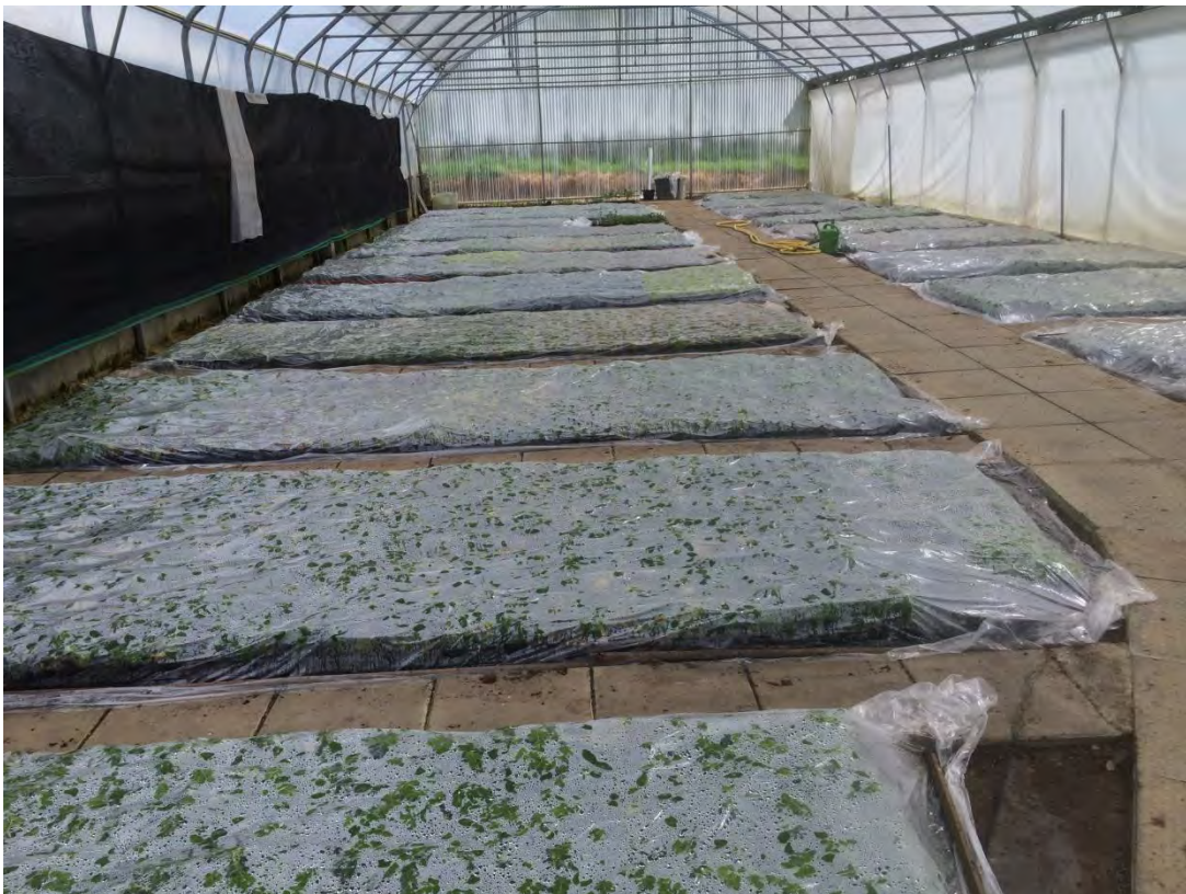
Abb. 5: Gewächshaus zur Stecklingsvermehrung verschiedener Bodendecker unter Folienabdeckung

In der Baumschule Ravensberg werden alle Kulturschritte, von der Vermehrung (generativ und vegetativ) bis hin zum Fertigprodukt, selbst durchgeführt.