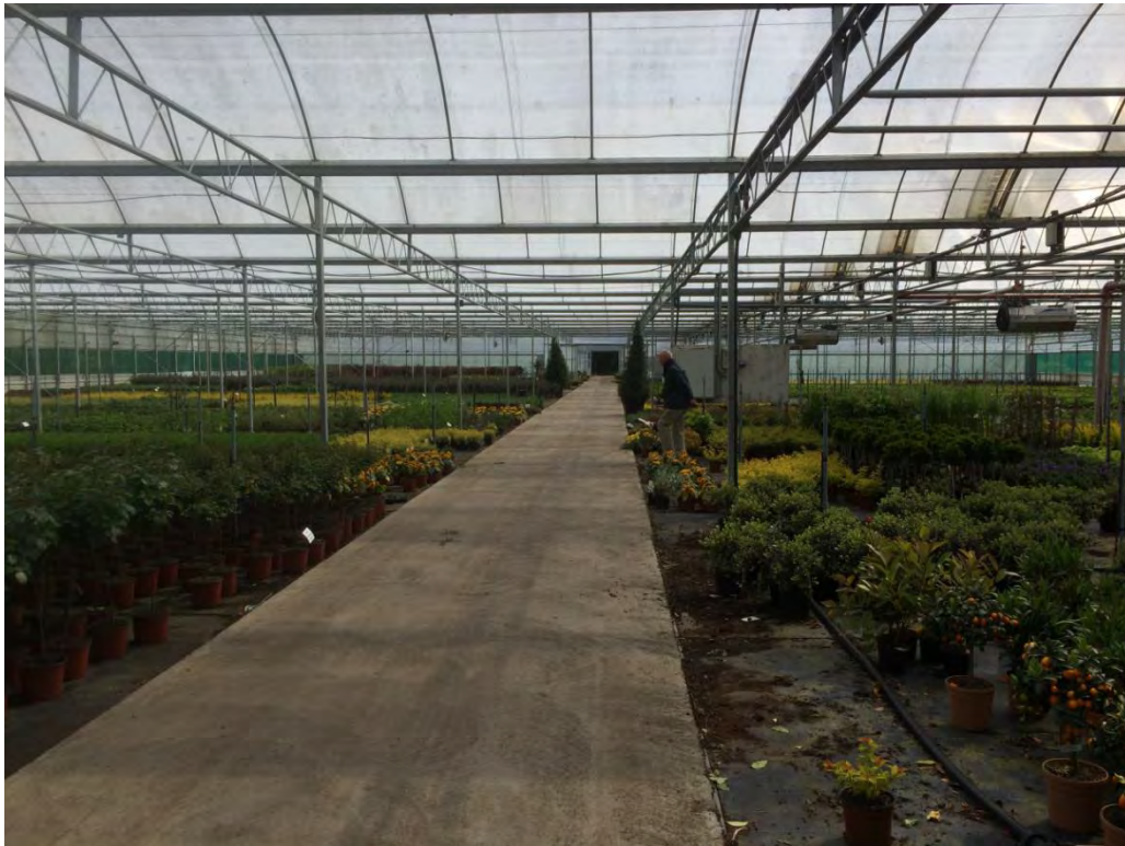
Abb. 14: Ein großer Teil der Produktionsfläche liegt unter Glas bzw. Folie