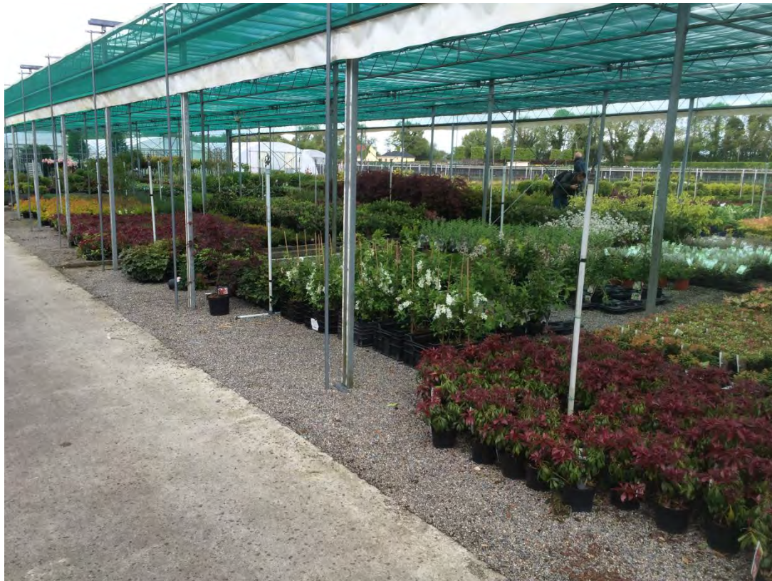
Abb. 15: In Schattenhallen steht das Sortiment für den Versand an die Gartencenter und den GalaBau bereit