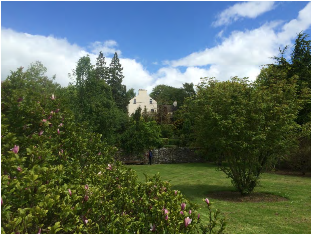
Abb. 9: Das in einem parkähnlichen Umfeld gelegene Wohnhaus der Familie Ravensberg