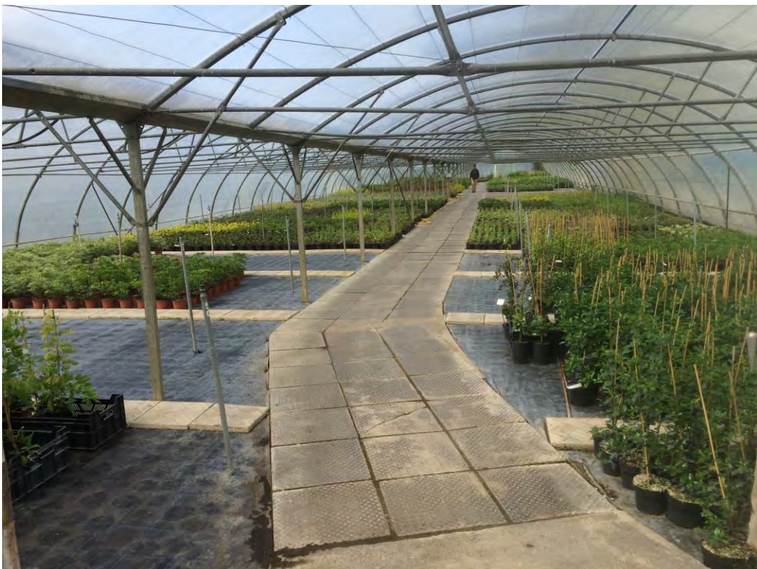
Abb. 8: Gewächshaus mit Ware für den Endverkauf und den Versand an Gartencenter