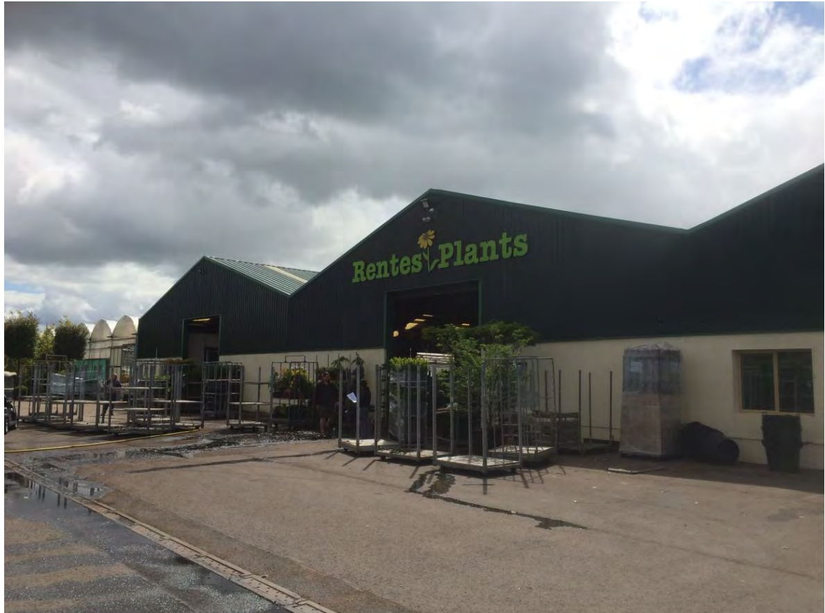
Abb. 10: Büros, Arbeits- und Versandhallen der Bauschule Rentes Plant, im Hintergrund links beginnen die Gewächshäuser

Im Betrieb arbeiten 4 Familienmitglieder und, neben Saisonkräften, weiter 13 festangestellte Mitarbeiter.