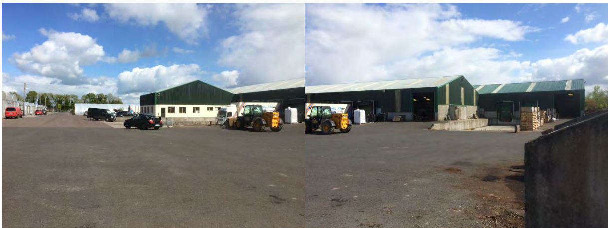
Abb. 11: Versandhalle mit Ladeschleusen für insgesamt 4 LKWs