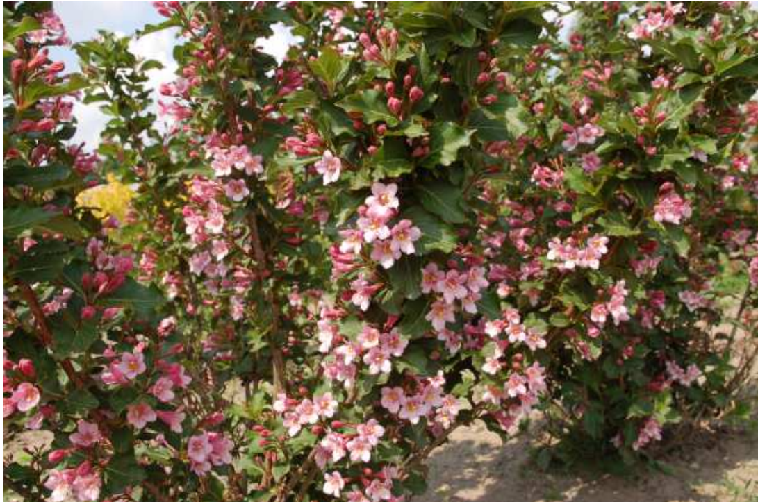
Abb. 4 Auch Weigela florida 'Polka' (Baumschule Kolster, NL) wurde nur in Ellerhoop geprüft und hat mit der Note 9,3 die viertbeste Bewertung für den Zierwert ihrer großen, hellrosa gefärbten Blüten erhalten