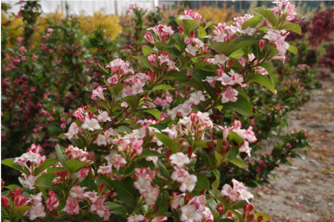
Abb. 2: Weigela florida 'Carnaval' wurde nur im Gartenbauzentrum der Landwirtschaftskammer Schleswig-Holstein in Ellerhoop geprüft und hat für die Wirkung ihrer Blüte die Bestnote 9,7 erhalten