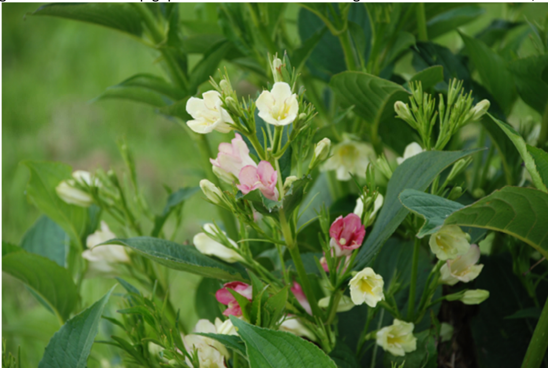
Abb. 3: Weigela hybr. 'Majorie' wurde von der Baumschule Kordes Jungpflanzen, Bilsen geliefert und hat mit der Note 9,5 die zweitbeste Bewertung für die Wirkung ihrer Blüten erhalten