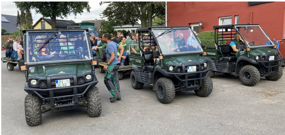
Abb. 1: Mit drei Kawasaki Mulen, hinter denen insgesamt 11 Plattformanhänger angehängt waren, wurden die Besucher zu den einzelnen Stationen gefahren

Am Mittwoch den 20.09.2023 trafen sich auf Einladung der LKSH und der Baumschule Johannes Clasen mehr als 60 interessierte Fachbesucher zum ToSBa-Feldtag. Dabei konnte erklärt und vor allem demonstriert werden, dass Torfersatz zu einem erheblichen Anteil bereits möglich ist. Dabei ist jedoch eine individuelle Anpassung der dabei eingesetzten Ersatzstoffe an die jeweilige Gehölzart und das eingesetzten Bewässerungssystem notwendig. Und gerade im ungeschützten Anbau der Baumschulen entscheidet oft auch der Witterungsverlauf über den Kulturerfolg. Die Notwendigkeit zur kultur- und betriebsspezifischen Anpassung des Substrats nimmt mit weiter steigendem Torfersatzanteil zu und stößt bei den derzeit im Baumschulbereich üblichen Kultursystemen und der produzierten Gehölzvielfalt oft an seine Grenzen.