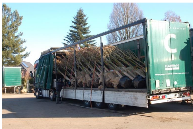
Abb. 1: Fertig verladene Bäume zur Auslieferung an einen der vier Projektstandorte in Heide, Husum Kiel und Lübeck im März 2016