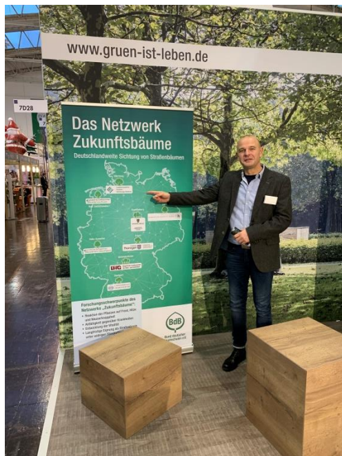
Abb.2: Präsentation des Netzwerks Zukunftsbäume, seinen Zielen sowie bisheriger Ergebnisse auf der IPM 202 in Essen, zu dem das Projekt der OG Klimawandelbäume einen wesentlichen Beitrag geliefert hat

Durch die Schaffung des Netzwerks Zukunftsbäume ist ein Rahmen geschaffen und verstetigt worden, der die Projektziele aufgreift und im Rahmen von gemeinsamen Projekten bearbeitet und kommuniziert. Auf der Internationalen Pflanzenmesse (IPM) 2020 in Essen wurde das Netzwerk und seine Arbeit einem internationalen Publikum auf dem Stand des BdB in Wort und Bild vorgestellt, wobei das Projekt der OG Klimawandelbäume eine Keimzelle und seine Ergebnisse eine wesentliche Informationsquelle darstellten (Abb. 2).