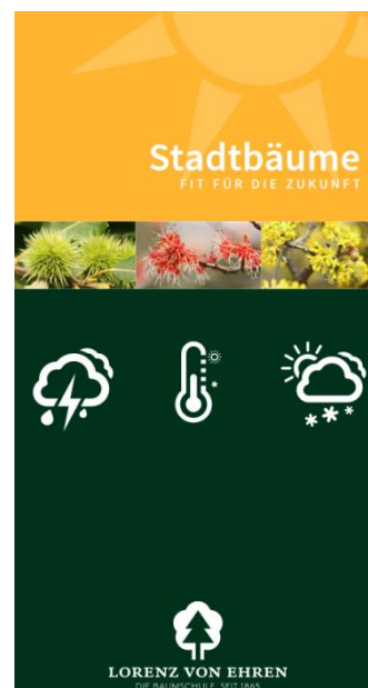
Abb. 3: Nur zwei Beispiele von Klimabaum-Broschüren der Baumschulen E. Sander (links) und Lorenz von Ehren (rechts)

Klimawandel-Haine in einigen Baumschulen dienen gezielt der Information von Planern und Kunden, die entsprechend auf großes Kundeninteresse treffen. Daneben sind die