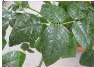
Honigtau auf Rosenblatt