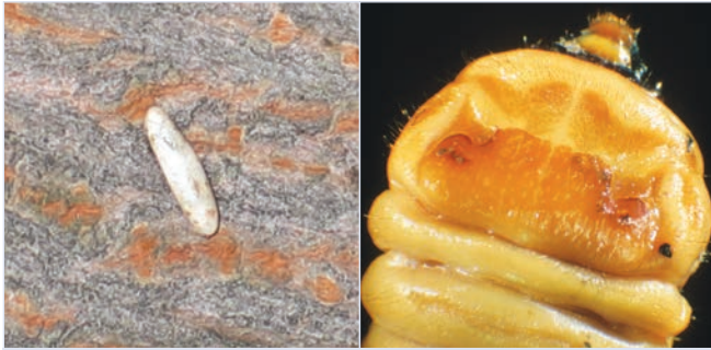
1. Reiskorngroßes Ei (7-8 mm)