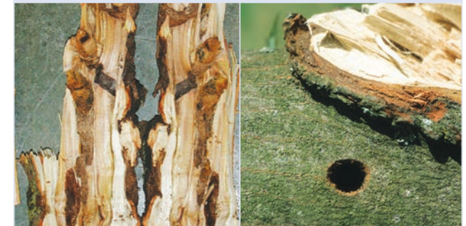
10. Breite Fraßgänge des ALB im Holzkörper