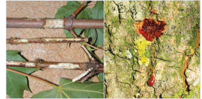
6. Reifungsfraß der Käfer an Ästen

Ausbohrlöcher: charakteristisch kreisrund, Durchmesser 1 - 1,5 cm (11).