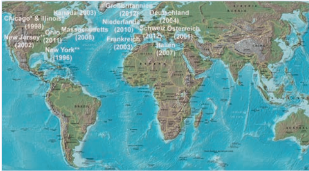
12. Jahr der Erstfunde des ALB unter Freilandbedingungen außerhalb seines Heimatgebietes in Asien (*ganz oder **teilweise ausgerottet)