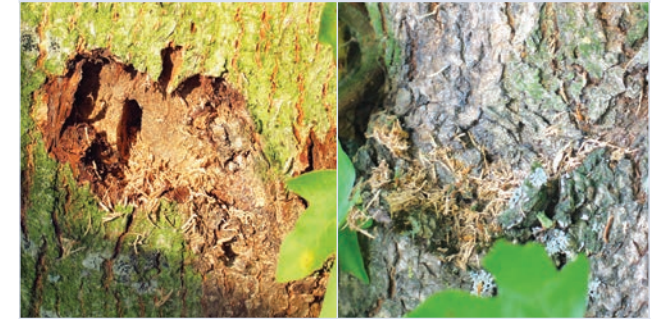
8. Larvenfraß unter der Rinde mit ovalem Einbohrloch der Larve