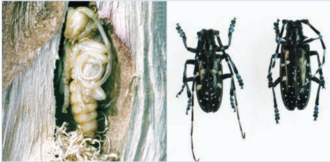
3. Puppe mit grobem Spanpolster in Puppenwiege